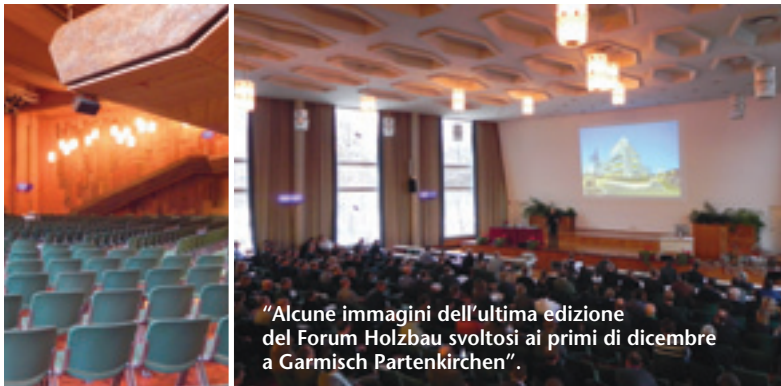
"Alcune immagini dell'ultima edizione del Forum Holzbau svoltosi ai primi di dicembre a Garmisch Partenkirchen".

"Sono entrato in questa storia quasi per caso", ci racconta. "Ebbi l'occasione vent'anni fa di partecipare come relatore a diversi convegni organizzati dai professori Heinrich Koester , oggi presidente della Hochschule di Rosenheim e del nostro forum, e Uwe Germerott della Berner Fachhochschule e oggi nostro amministratore delegato. Esperienze che erano l'embrione dell'Holzbau Forum, nato